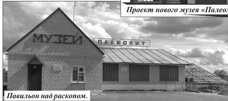
Проект нового музея «Палеолит».

Фокинском районе, областного центра лыжного спорта в Бежицком районе, зданий для мировых судей судебных участков в Стародубе, Комаричах, Суземке, Мглине, домов для детей-сирот в Унече, культурно-досуговых центров в Севске и Почепе, спортивно-оздоровительного комплекса в поселке Локоть, детского сада в Жуковке, фельдшерско-акушерских пунктов в Климовском и Суражском районах, комплексного центра помощи семье и детям в Суземке,