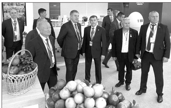
заслужили престиж и уважение в своих сферах.