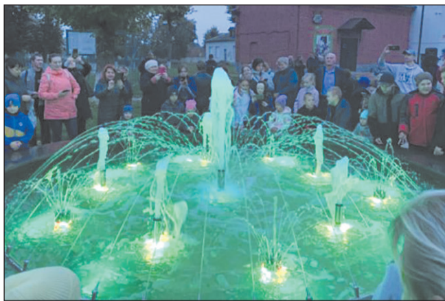
боты по обновлению фонтана выполнило общество с ограниченной ответственностью «Вертикаль».

В этом году погарцы предложили обновить в райцентре фонтан. Все работы выполнены за средства областного и местного бюджетов, а также по условиям программы проекта софинансировали организации, предприятия и жители райцентра. Все ра-