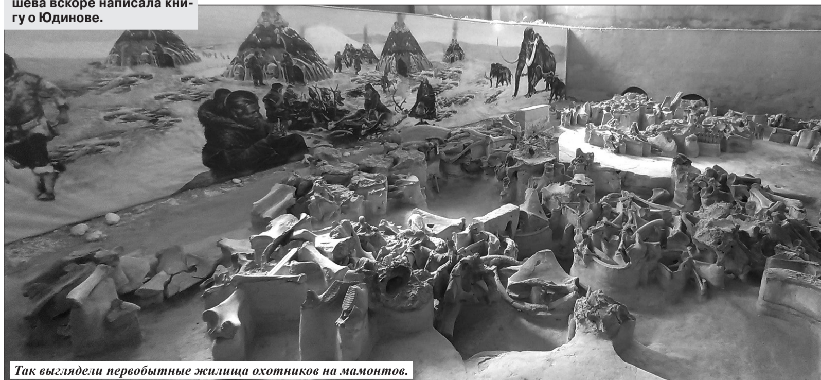
Так выглядели первобытные жилища охотников на мамонтов.